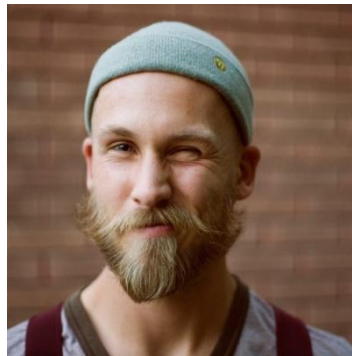
Айболит – рядовой, стрелок, медик