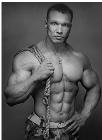
Зверь – старший лейтенант, стрелок