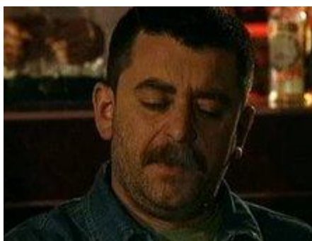
Сталин – рядовой, пулеметчик

Внешность была заимствована из сериала «Возвращение Титаника 2» (2004)