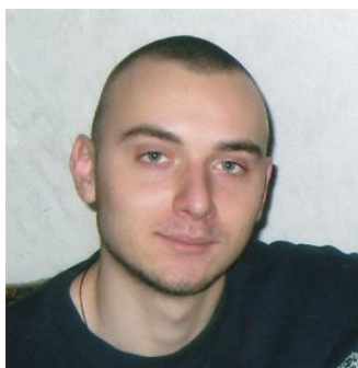
Кактус – капитан, главный стрелок