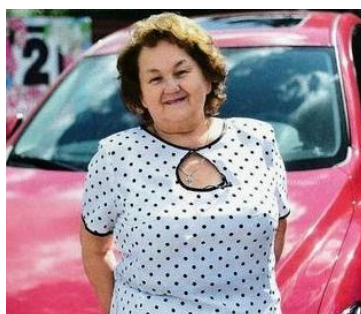
Элеонора Гамильтон – добрая колдунья