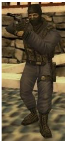
Французская GIGN («Группа вмешательства национальной жандармерии»)