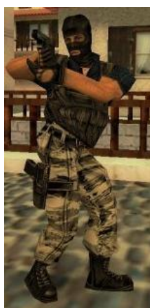
Ближневосточная Phoenix Faction («Подразделение «Феникс»»)