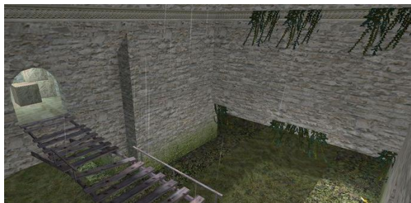
Мостик между базой «В» и главным залом