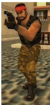
Средневозвосточная Guerrilla Warfare («Партизаны»)