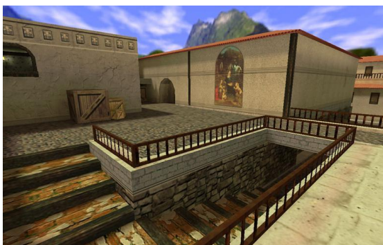
Место появления террористов. В доме слева держат заложников