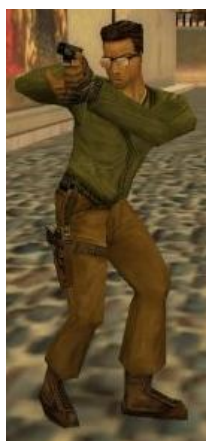
Среднеазиатская Elite Crew («Элитное подразделение»)