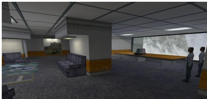
Место с заложниками