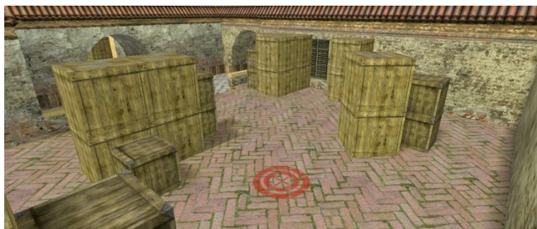
Место закладки бомбы «А»