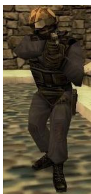
Немецкая GSG-9 («Группа охраны границ 9»)