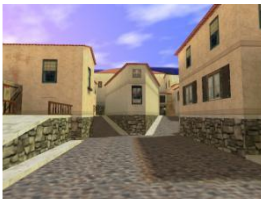
Место появление спецназа