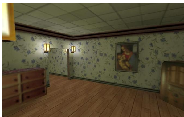
Внутреннее убранство домов