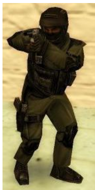
Американская Seal Team 6 («Морские котики»)