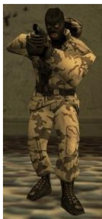
Шведская Arctic Avengers («Арктические мстители»)