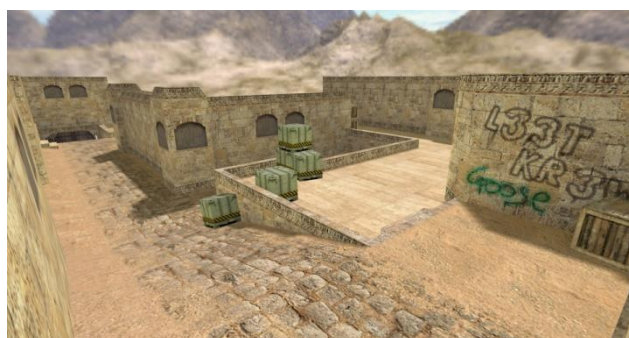
Место закладки бомбы «А»