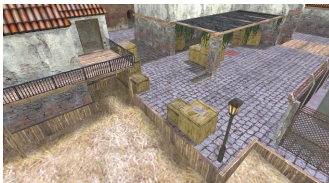
Место закладки бомбы «В». Навес