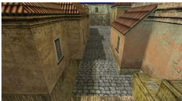
Пространство между тоннельчиком с места появления террористов и подъемом на базу «В»