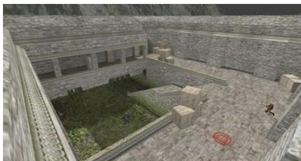
Главный зал. Место закладки бомбы «А»