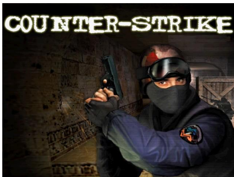
Классический задний фон меню «Counter-Strike» ранних версий