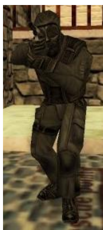
Великобританская SAS («Специальная авиадесантная служба»)