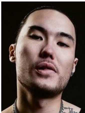
Аслан Оспанов - главный герой, сын Касымхана, друг Кайрата, племянник Мустафы, грузчик (внешность была заимствована у рэпера Скриптонита)