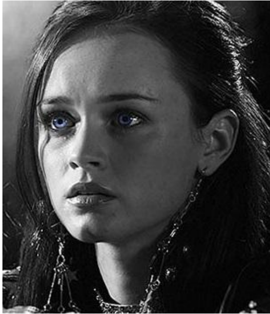
Одри Джэксон - главная героиня, Одри «Смит», «жена Стивена», «мать Лилы», дочь Опры, пациентка психбольницы (внешность была заимствована из фильма «Город грехов» (2005))