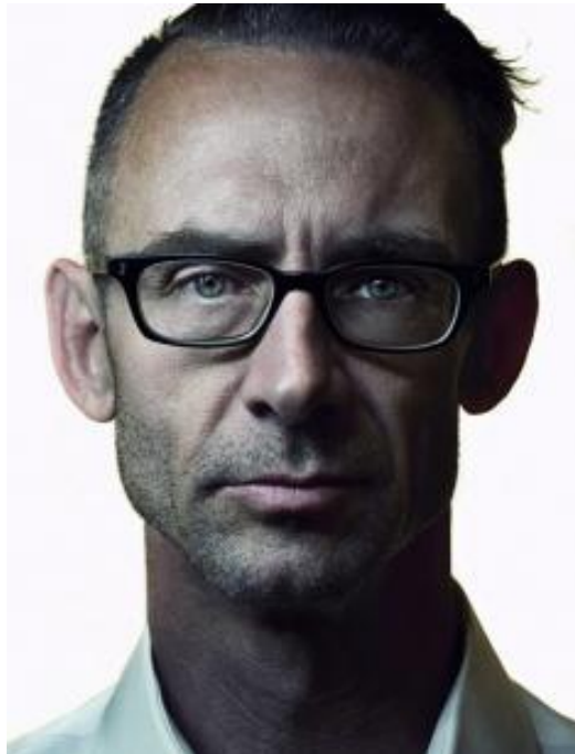
«Стивен Смит» - «муж Одри», «отец Лилы», «зять Опры», «писатель» (внешность была заимствована у писателя Чака Паланика)