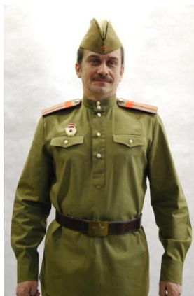
Призрак солдата ВОВ