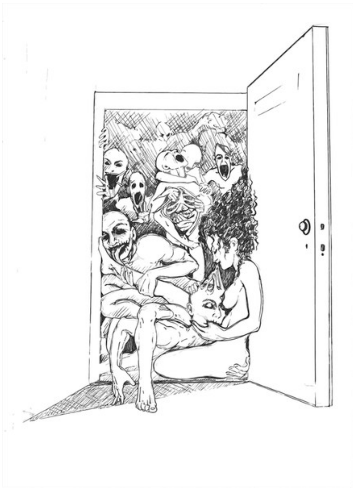
Часть 2. Загляни в замочную скважину